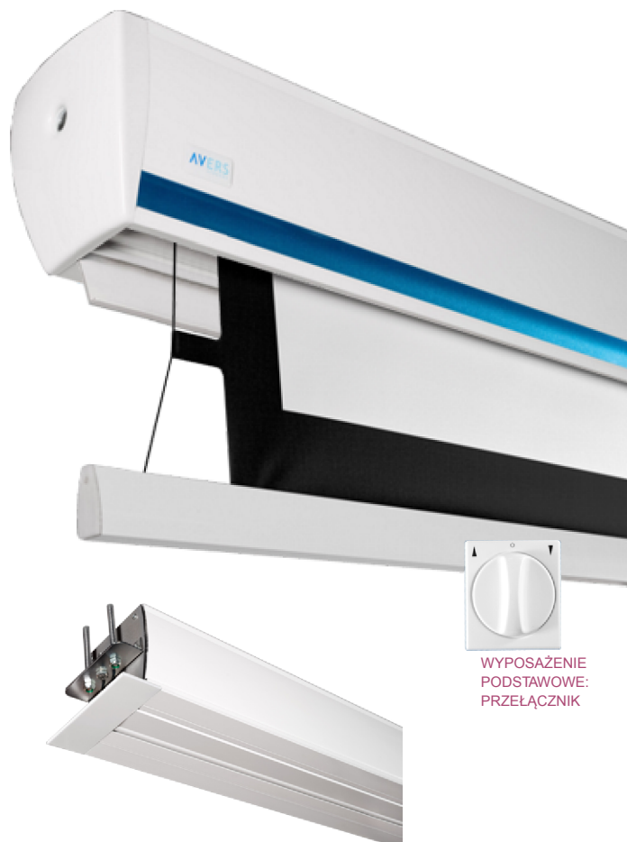
WYPOSAŻENIE PODSTAWOWE: PRZEŁĄCZNIK